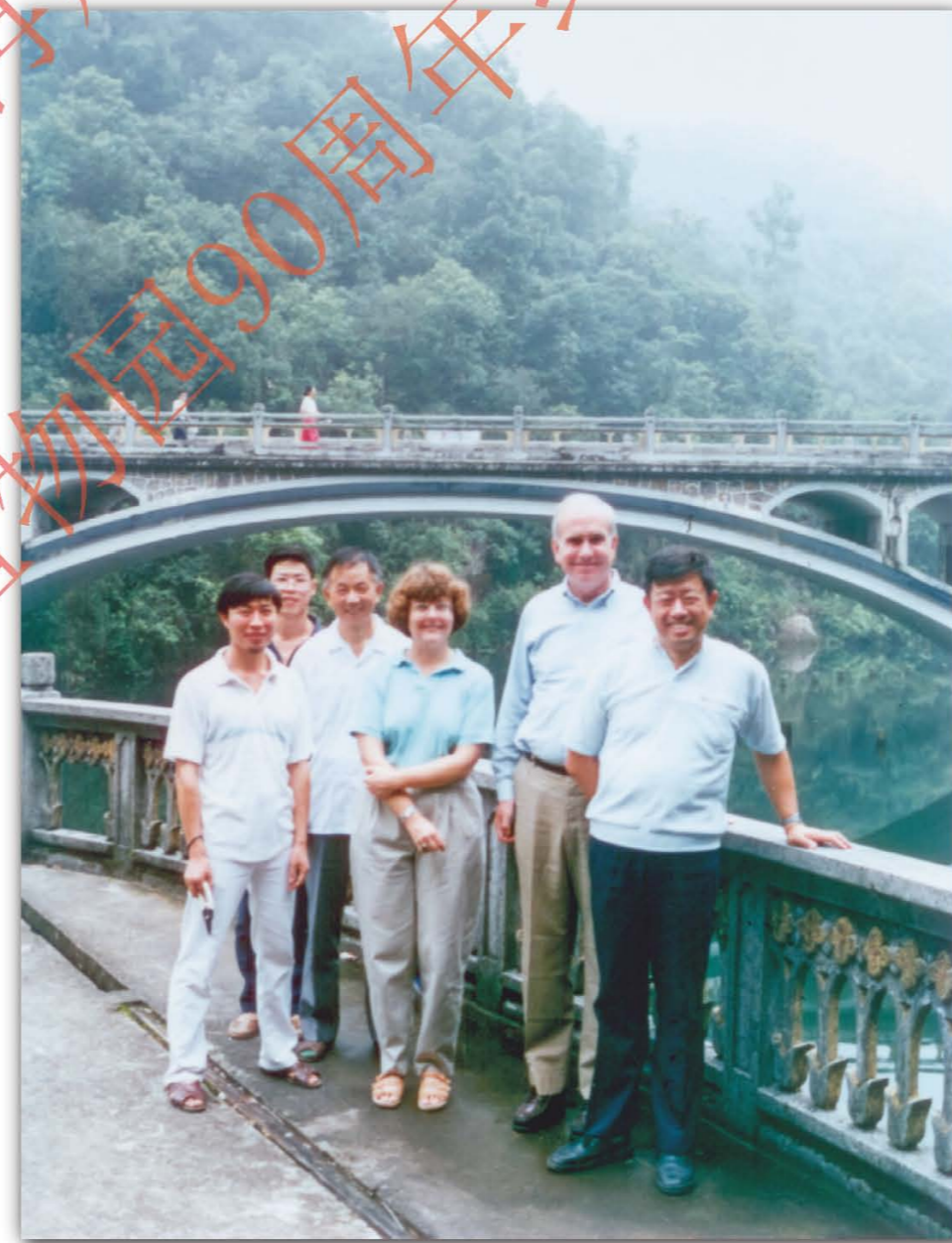
1989年，美国密苏里植物园主任Peter Raven(右二)访问鼎湖山