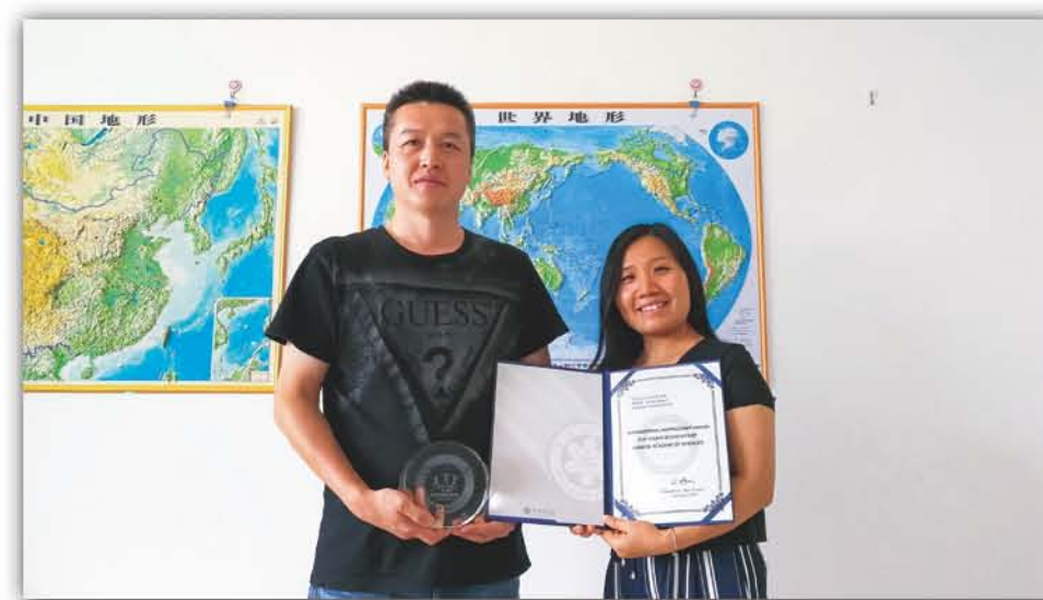
2016年, 黄建国研究员获得中科院2016年度青年科学家国际合作伙伴奖