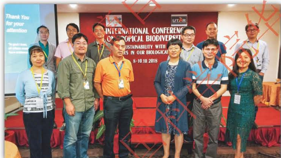
2018年, 华南植物园协办的热带地区生物多样性国际会议在马来西亚怡保召开