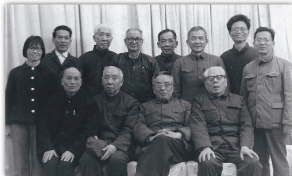
20世纪70年代，挂靠华南植物研究所的广东省生理学会理事与汤佩松院士（前排右二）合影