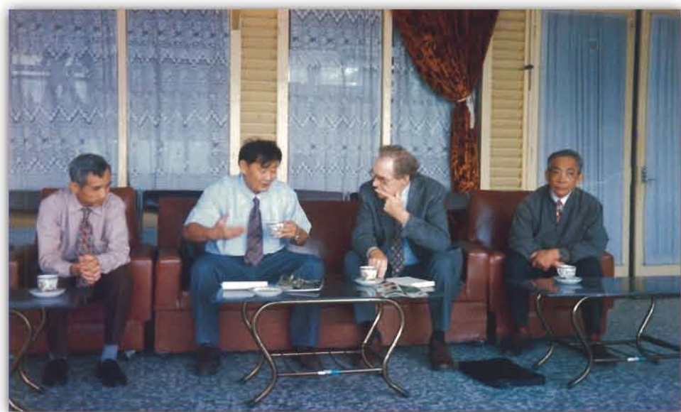
1995年, "Nature" 杂志主编Maddox(左三)来华南植物研究所采访