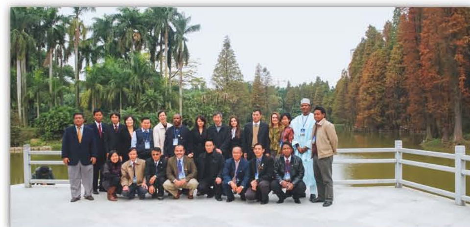
2009年, 华南植物园首次承办商务部国际培训班, 至今已举行了五届