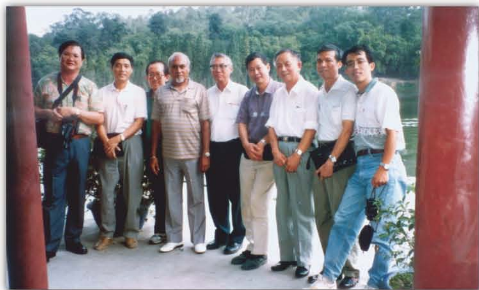
1995年, 新加坡科技代表团来访