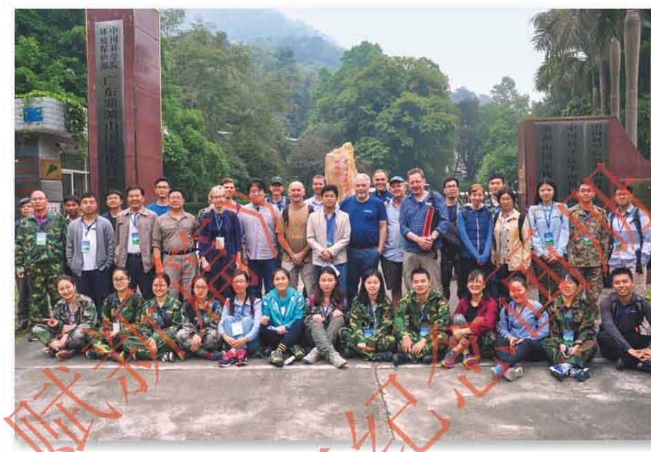
2018年, 国际长期生态研究未来十年战略研讨会 在华南植物园鼎湖山自然保护区管理局举行