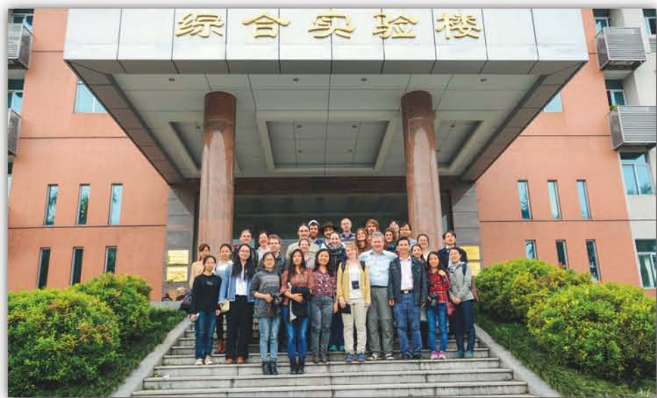
2015年, 德国拜罗伊特大学访问华南植物园