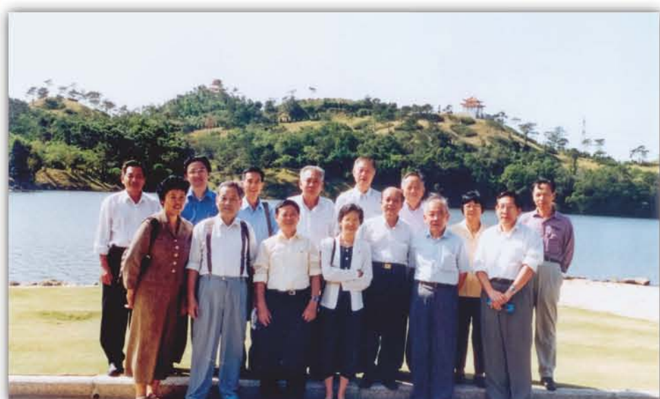
2000年, 华南植物研究所学术委员会成员到深圳仙湖植物园考察