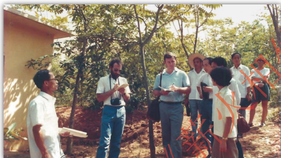
1985年，参加中美植物生理研究合作的两位犹他大学教授与华南植物所专家进行野外考察