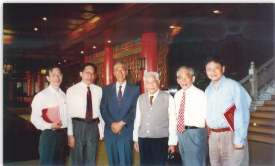
1996年, 华南植物研究所代表团访问台湾