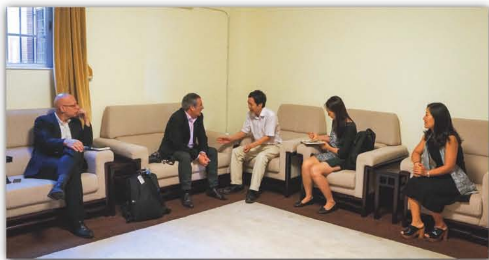
2015年, 法国驻广州总领事馆到华南植物园交流