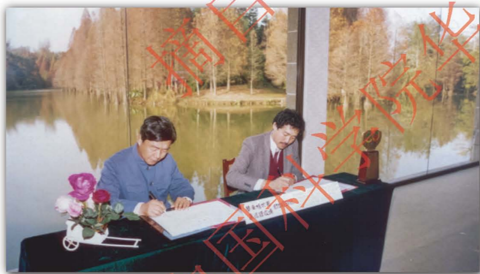
1987年，华南植物园与香港嘉道理农场暨植物园缔结姊妹园