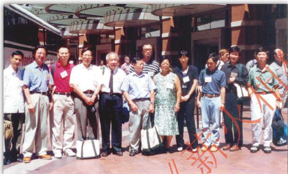
1999年, 华南植物研究所科技人员参加在美国召开的第16届国际植物学大会