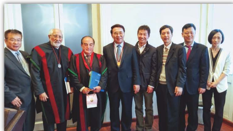
2017年, 中科院院长、党组书记白春礼(左四)、华南植物园主任任海(右三) 访问玻利维亚