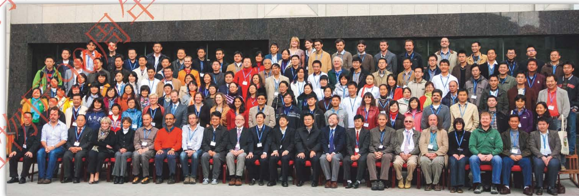
2009年, 华南植物园承办的New Phytologist 第23届国际学术研讨会在广州举行