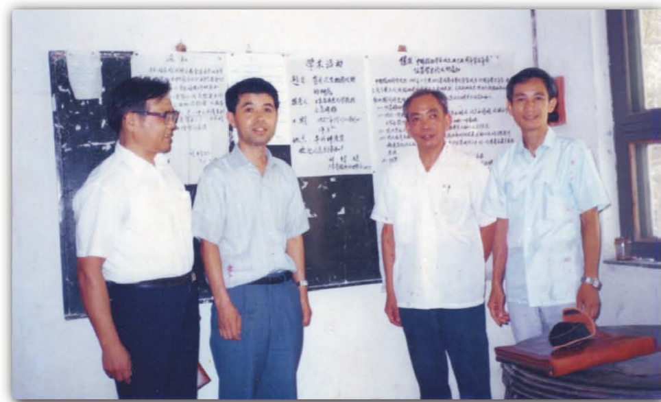
1987年，亚洲植物园协会主席Eva Suki（左二）来访