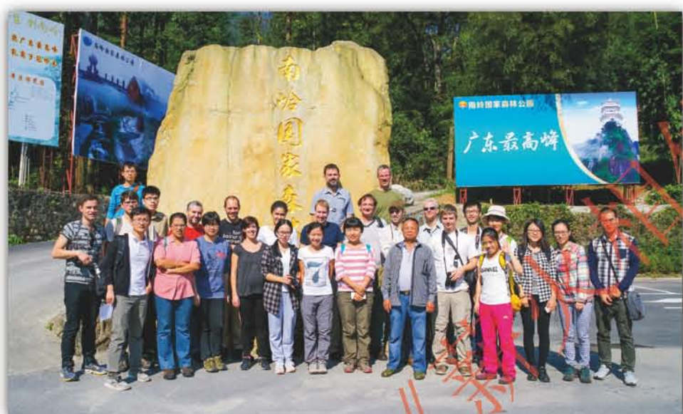
2015年, 番荔枝科国际研讨会在华南植物园召开