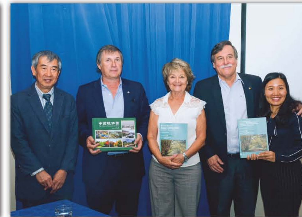
2018年, 华南植物园与阿根廷INTA合作的书籍出版, 举行赠书仪式