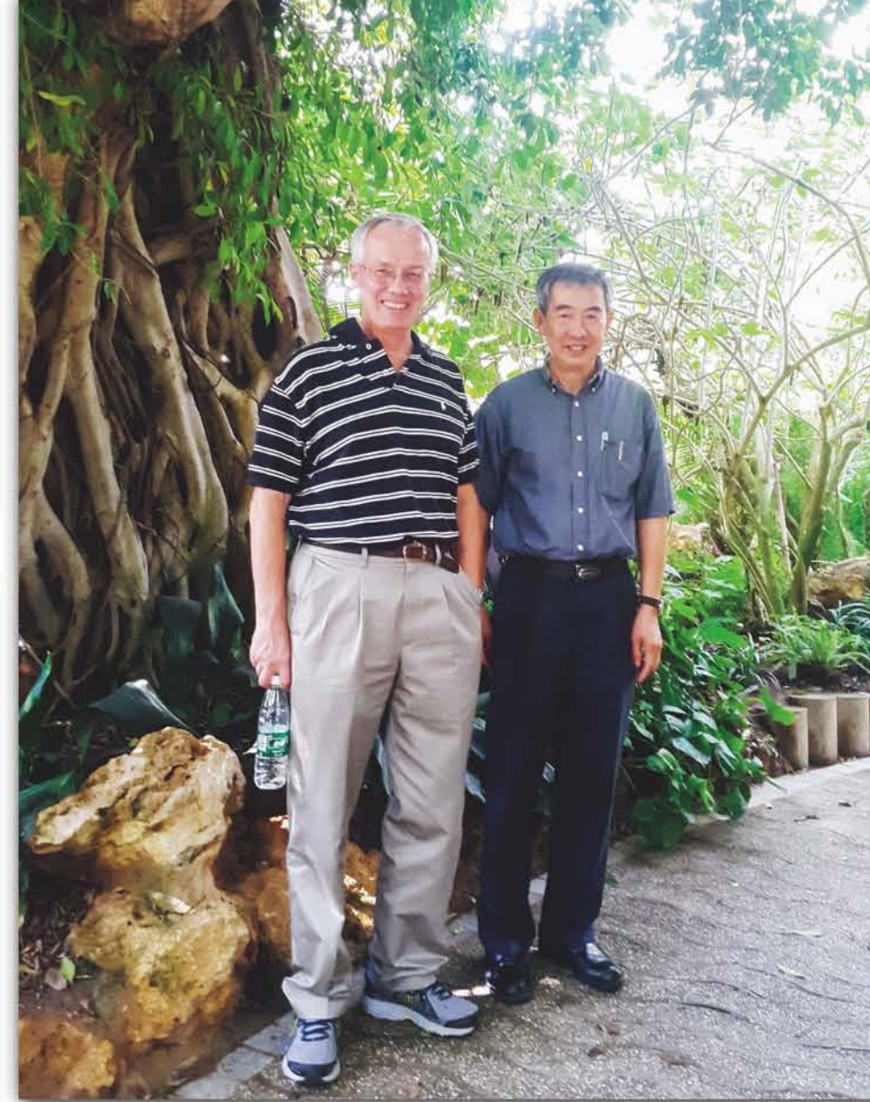
2015年, 国际著名植物学家、耶鲁大学Peter Crane教授(左)访问华南植物园