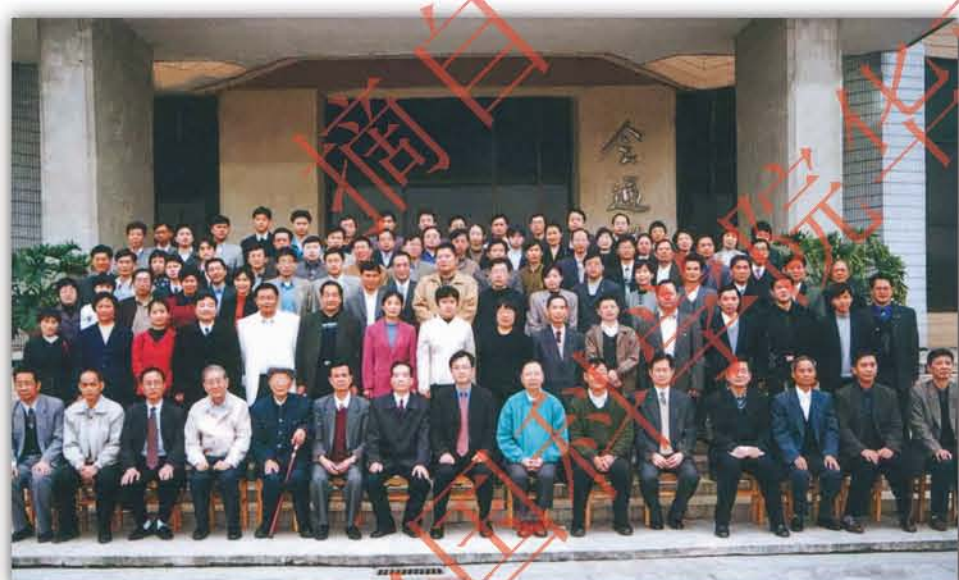
2000年, 参加挂靠华南植物研究所的广东省遗传学会年会的全体代表