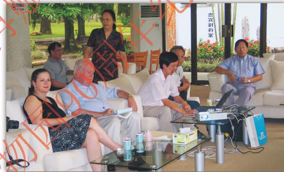
2003年, 美国密苏里植物园主任Peter Raven博士(前排左二)访问华南植物园