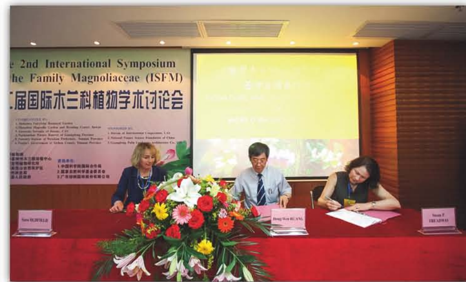
2009年, 第二届国际木兰科植物学学术讨论会暨“世界木兰中心”合作协议签字及揭牌仪式在华南植物园举行