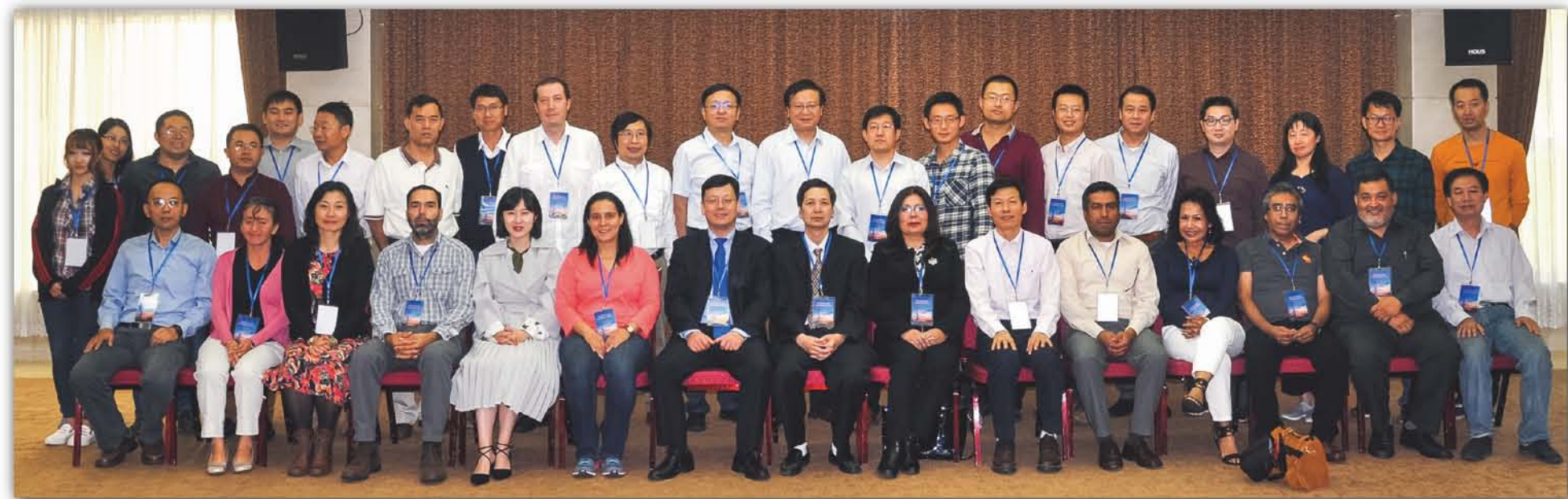
2017年, 华南植物园科技人员参加中国—拉美国国家植物多样性保护学术研讨会