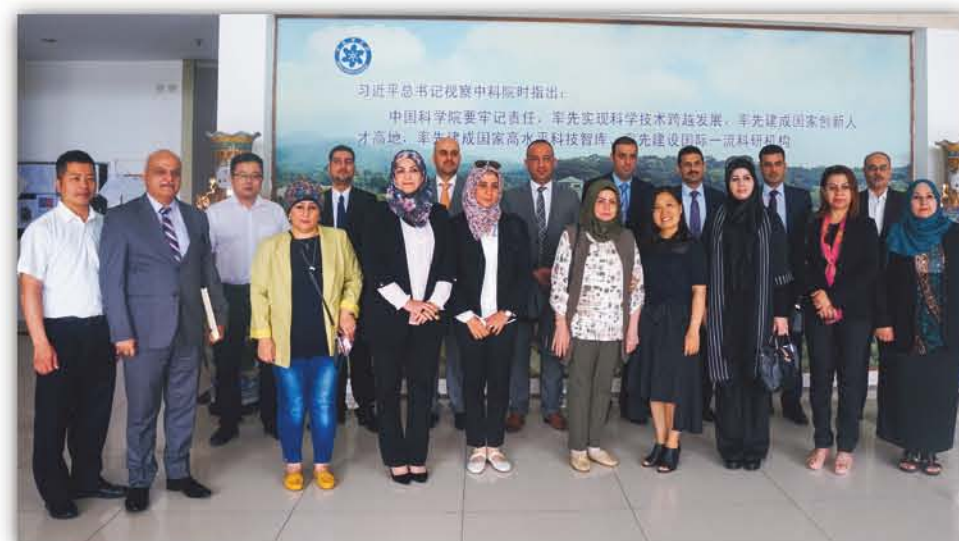
2018年, 伊拉克危机管理研修班访问华南植物园