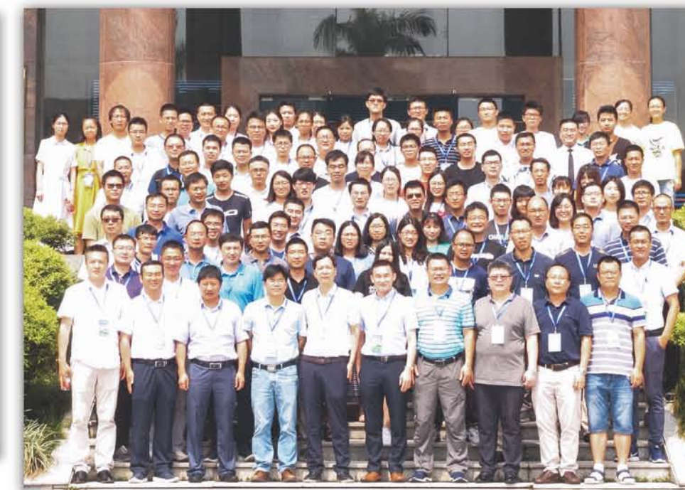
2018年, 第四届陆地生态学青年学者学术研讨会在华南植物园召开