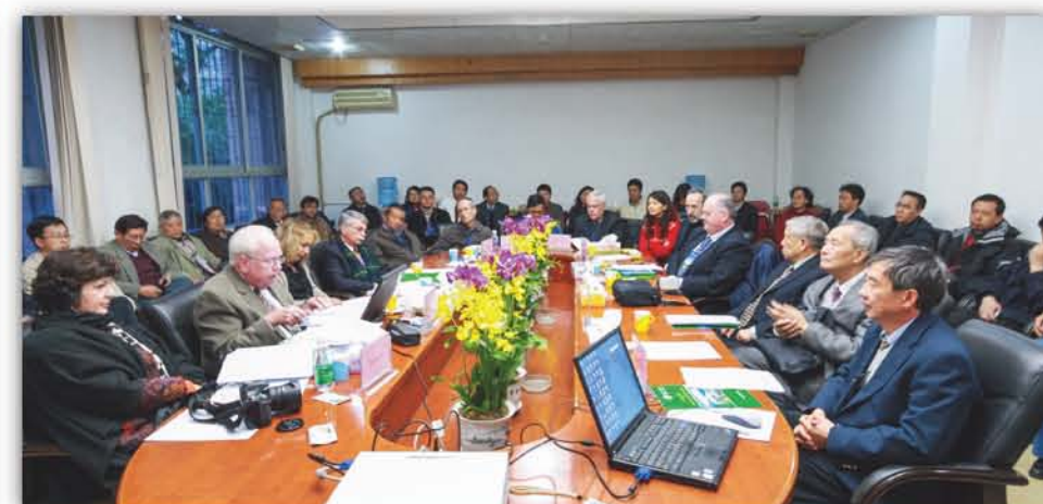
2009年, 华南植物园进行了为期2天的国际战略评估