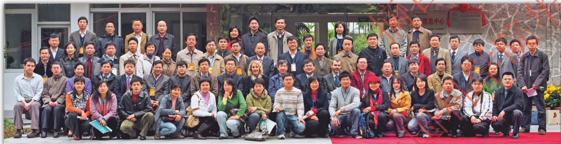
2008年, 华南植物园正式对外发布《中国植物保护战略》(CSPC), 同时正式启动国际植物园保护联盟(BGCI)中国办公室, 并举办了BGCI中国项目高级研讨会