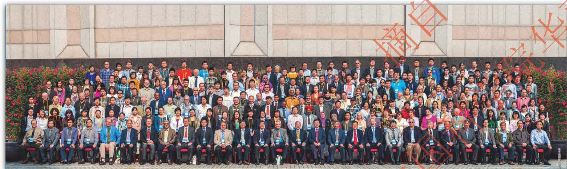
2012年, 华南植物园承办的第十三届国际植物园协会大会在广州召开