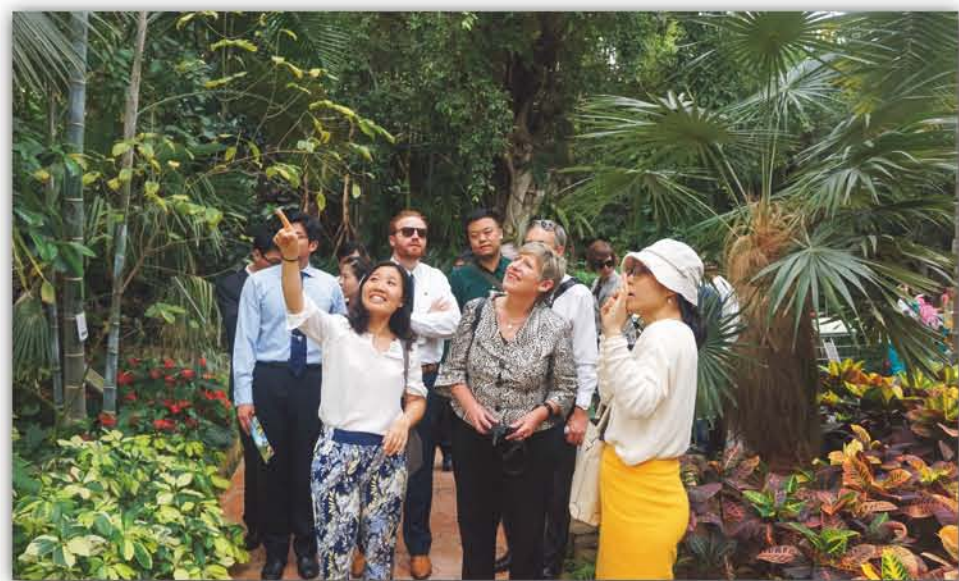
2015年, 新西兰Christchurch市市长代表团访问华南植物园