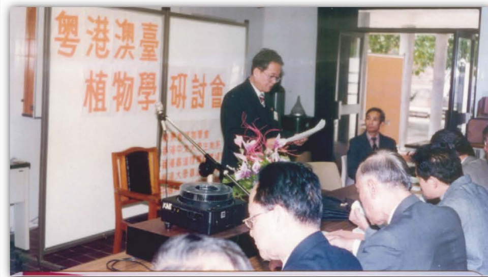
1993年，挂靠华南植物研究所的广东省植物学会在香港组织召开的“粤港澳台植物学研讨会”