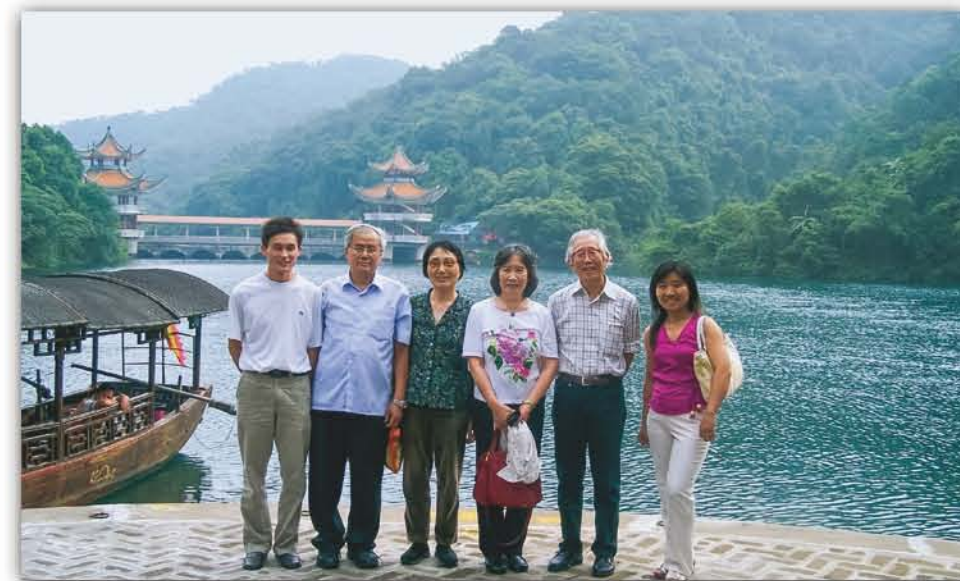
2006年, 诺贝尔奖得主白川英树(右二)及夫人和曹镛院士(右二)及夫人访问鼎湖山自然保护区