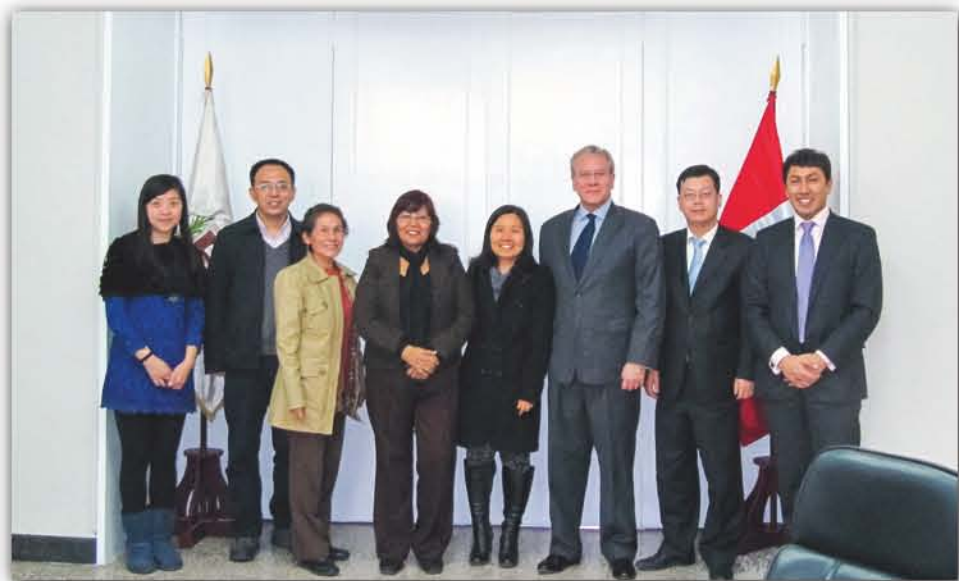
2012年, 华南植物园代表与秘鲁驻中国大使(左三)合影