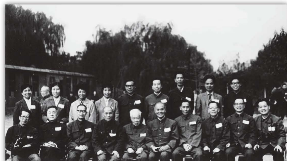
1983年，参加在太原举行的中国植物学会五十周年年会的广东省全体代表合影