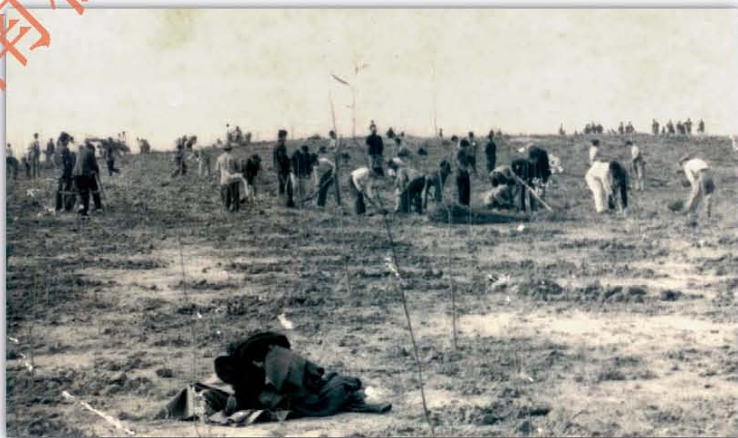
建设初期, 职工们肩扛手抬, 用汗水浇筑“龙洞琪林”