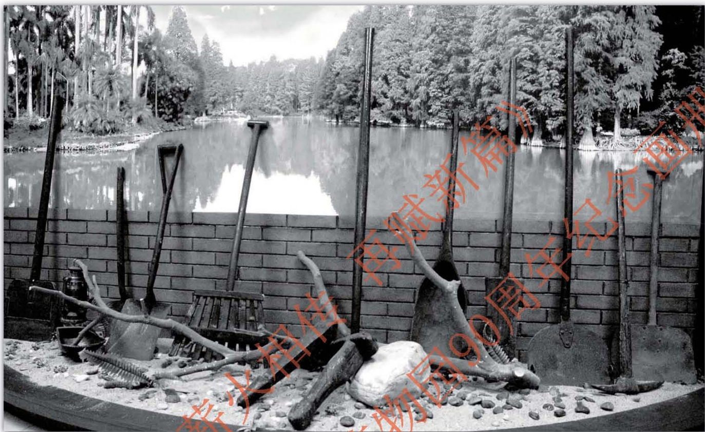
建设初期使用的劳动工具