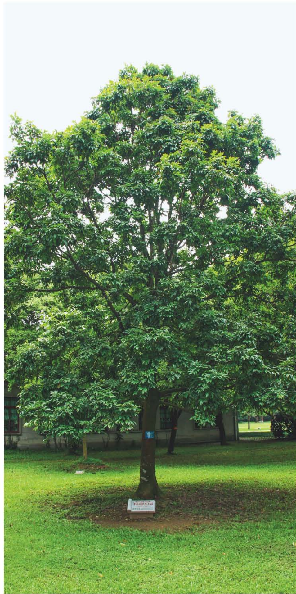
海南红豆——1992年10月7日，时任新加坡资政（前总理）李光耀手植