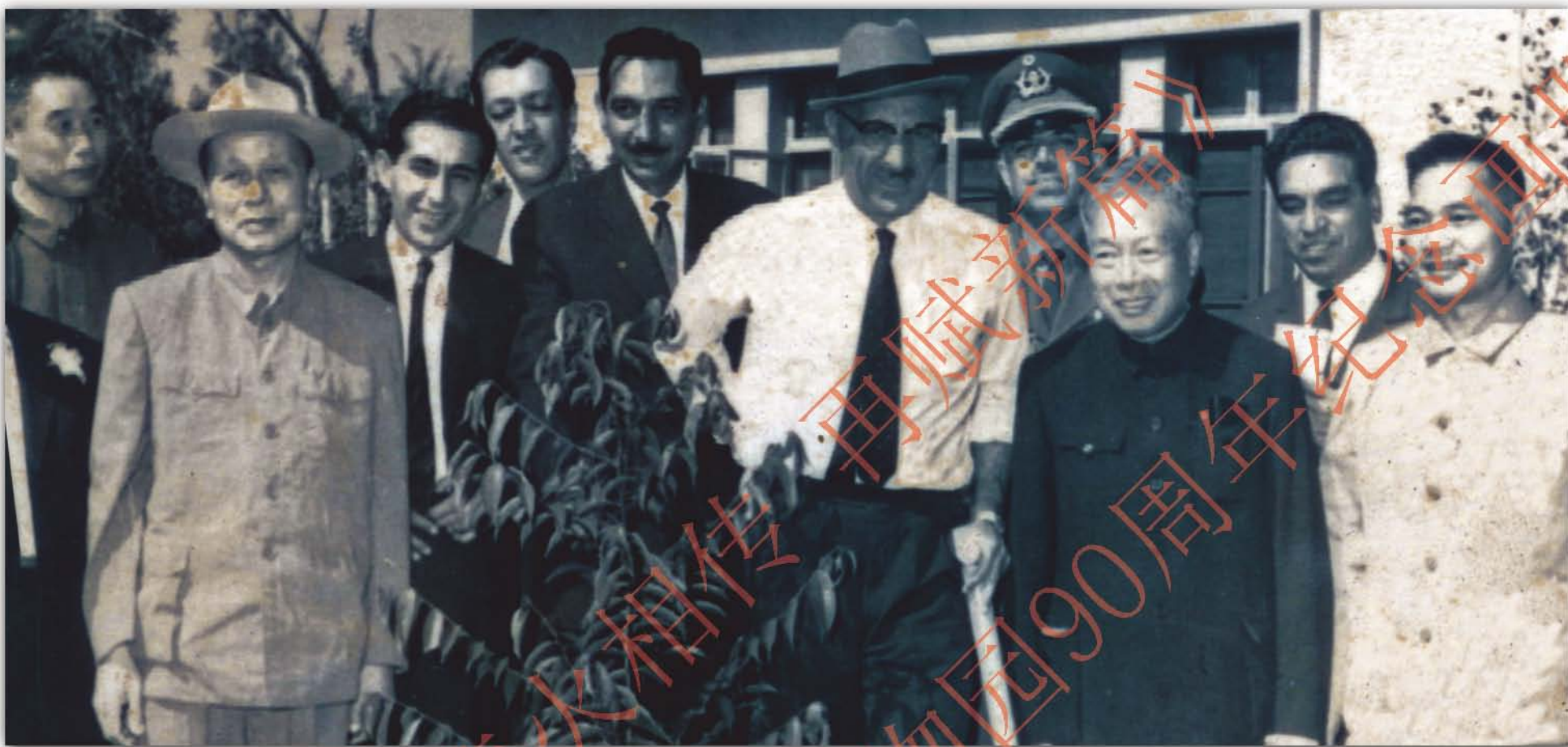
1964年，阿富汗国王穆罕默德·查希尔·沙阿来园参观并种植红花天料木 Homalium hainanense

新中国成立后，华南植物园在中国的外交舞台上还担当着“友好大使”的形象角色，接待了不少的外国元首和贵宾。