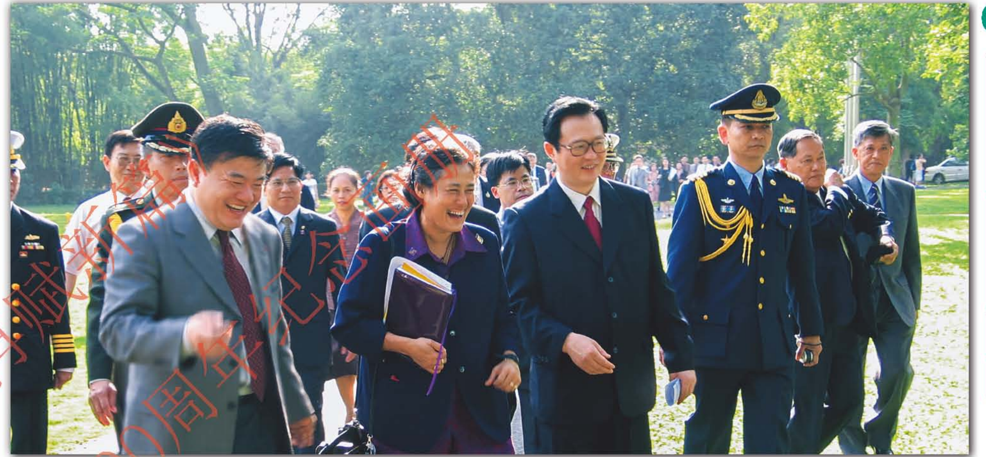
2003年，泰国诗琳通公主（前左二）访问华南植物园