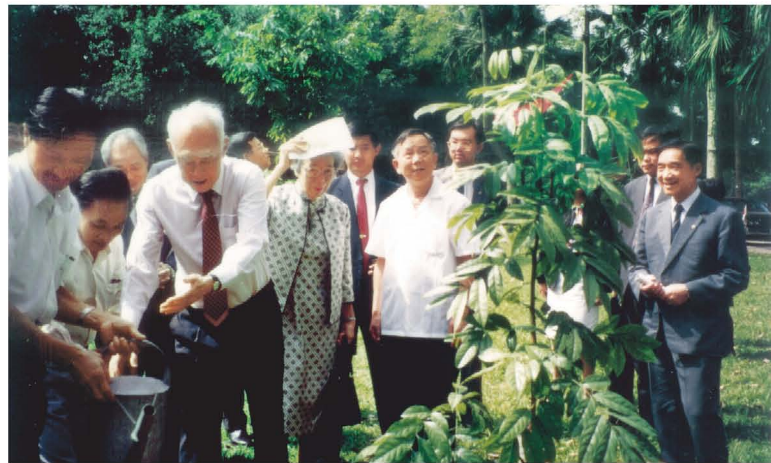
1992年，新加坡资政前总理李光耀偕夫人参观华南植物园