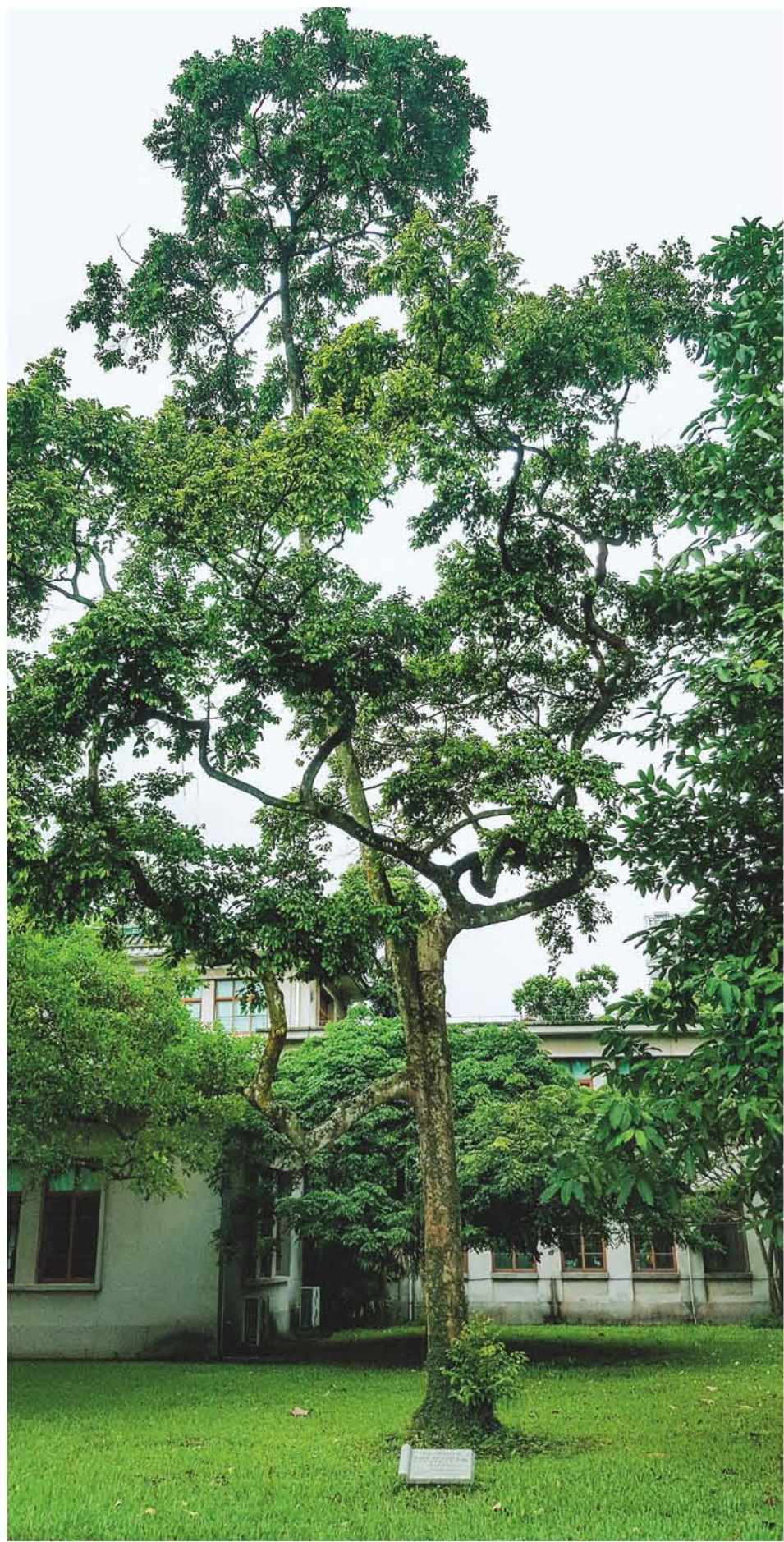
红花天料木——1964年11月6日，阿富汗国王穆罕默德·查希尔·沙阿和王后霍梅拉·查希尔·沙阿共植