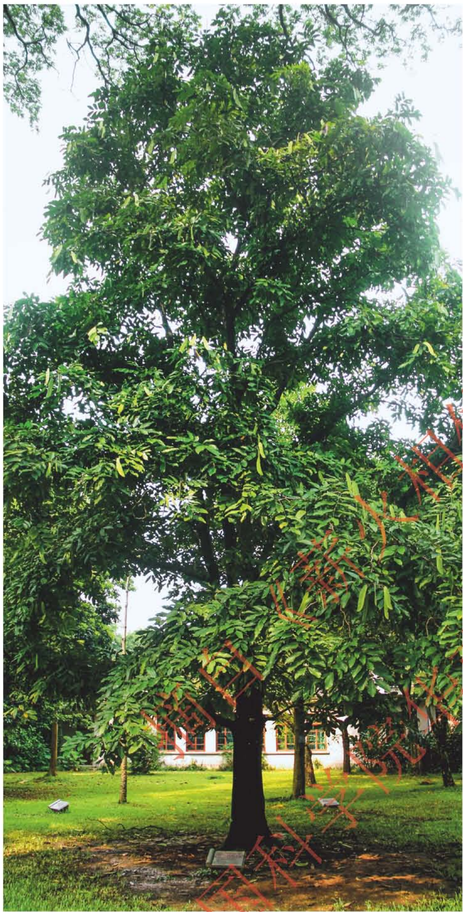
无忧树——1986年1月17日，时任民主柬埔寨主席诺罗敦·西哈努克亲王和夫人莫尼克·西哈努克公主共植