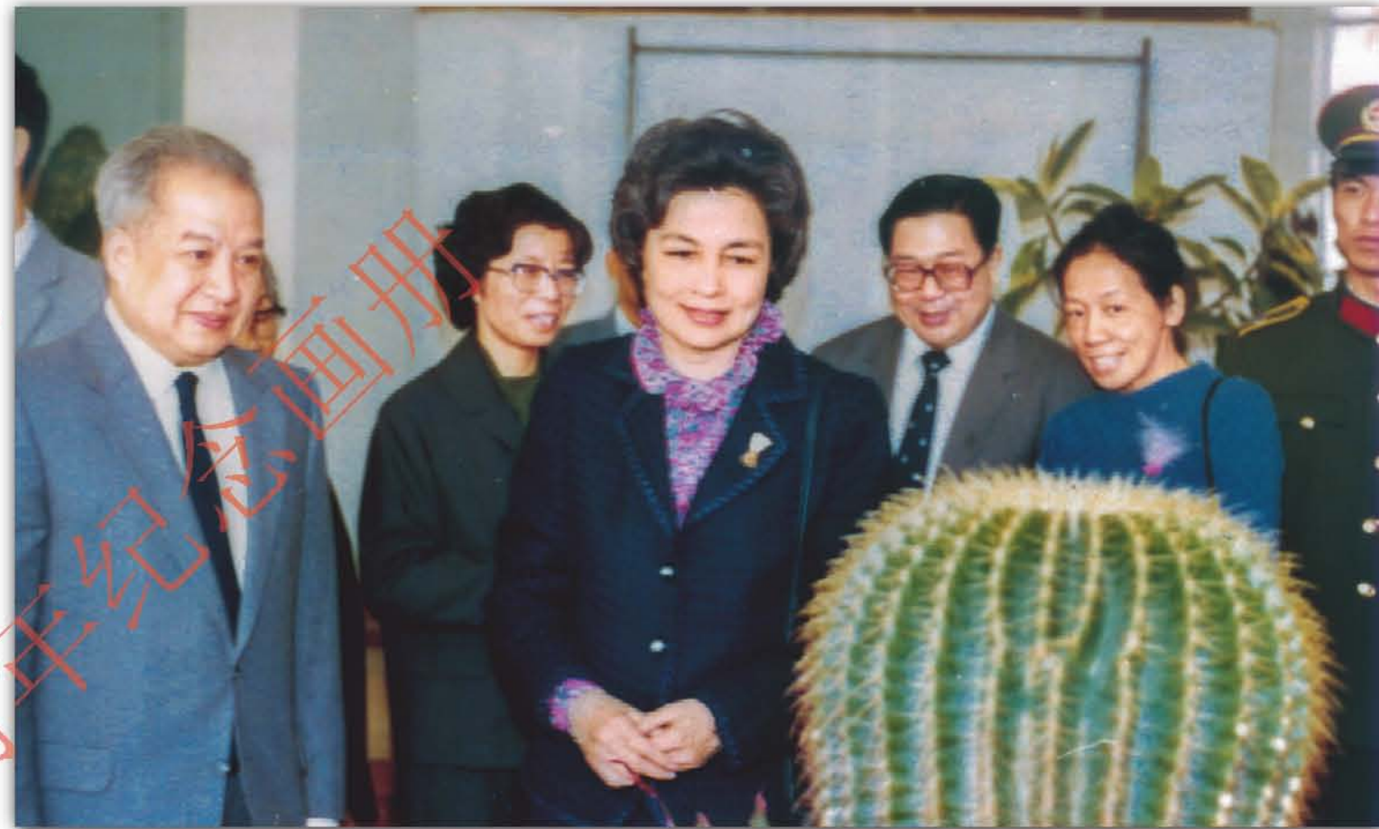
1986年，柬埔寨西哈努克亲王偕夫人参观华南植物园